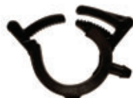
ANNEAU DÉRIVATION INTÉGRÉ INTEGRAL DRIPLINE TAKE-OFF ADAPTER CLAMP