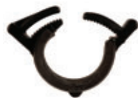
ANNEAU BOUCHON INTÉGRÉ INTEGRAL DRIPLINE PLUG CLAMP